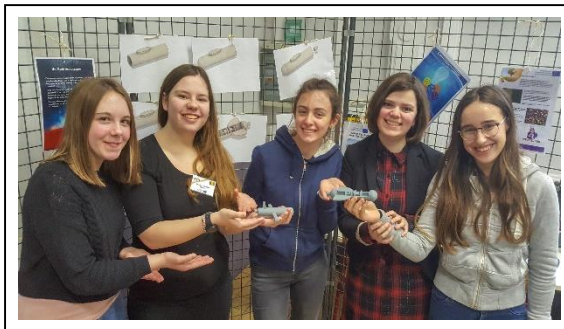
Projet Erasmus Plus « SEA » avec notre école partenaire grecque