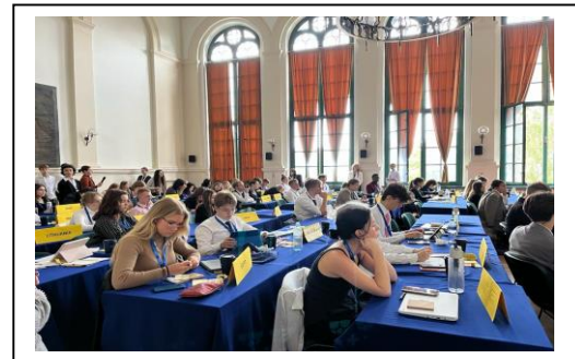
Conférence ToMUN organisée par notre école partenaire de Torún en Pologne