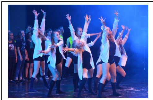
« Le meilleur des mondes », Mai 2019