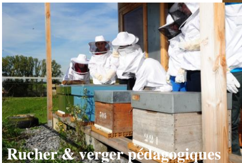
Rucher & verger pédagogiques