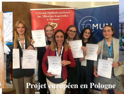
Projet européen en Pologne