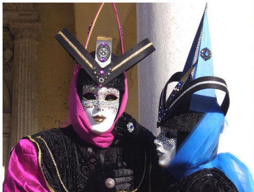
Voyage des 5e au carnaval de Venise