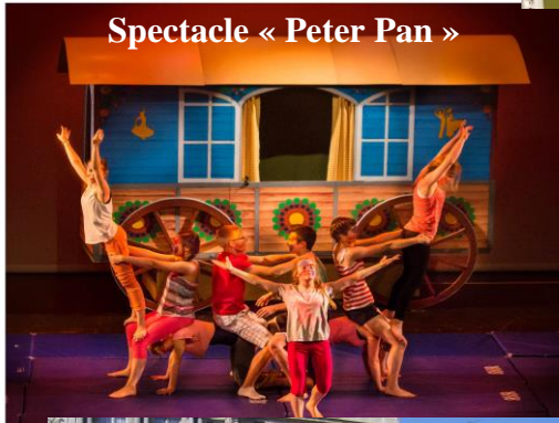
Spectacle « Peter Pan »