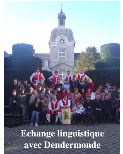
Echange linguistique avec Dendermonde