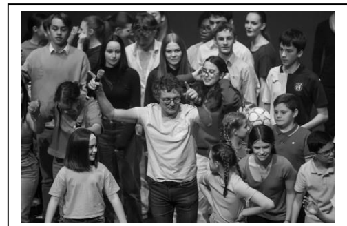
« Terre Neuve » - Avril 2024