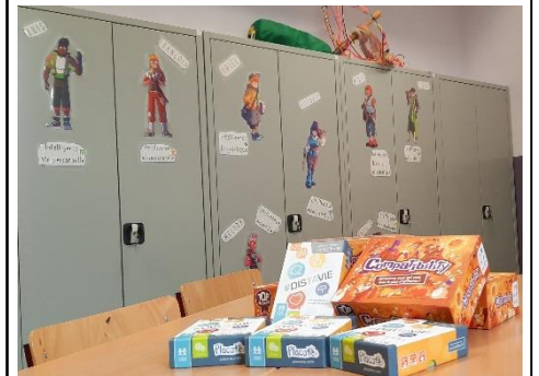
Centre ludopédagogique des talents