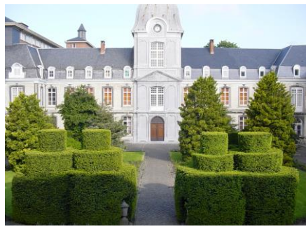
La cour d'honneur