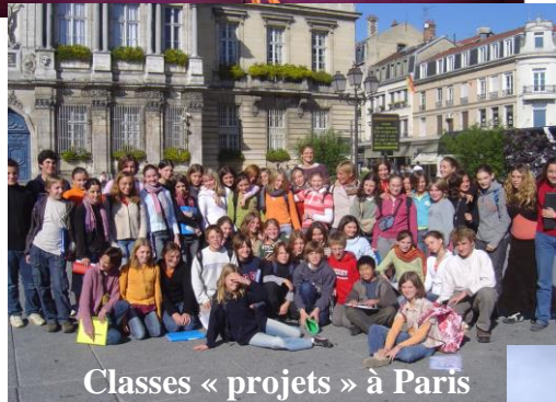
Classes « projets » à Paris