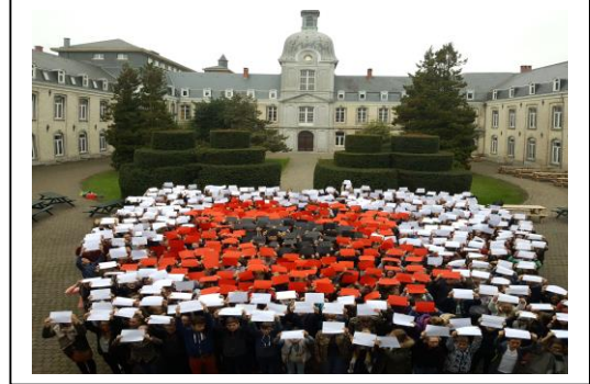
Champion, « Coquelicot » - Commémoration 14-18