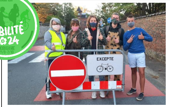
Mobigame, action mobilité autour de l'école