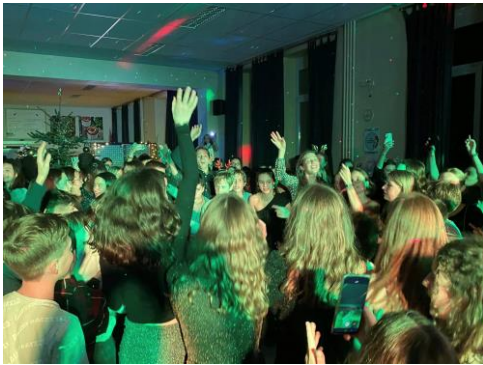
Bal de Noël du 1 er degré