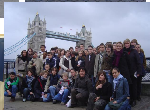
Voyage en Angleterre des 3e option anglais