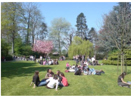
Une vue du parc

Après leur temps de repas, les élèves se retrouvent dans le parc, la cour d'honneur, l'espace avant ou dans la cour de récréation pour se détendre ou pratiquer du sport (mini-foot, basket...). D'autres activités sont également organisées : remédiations (français, math, langues, sciences & EDM), tennis de table, centre ludopédagogique des talents, club d'échecs, atelier d'art, réunions de préparation (groupes de travail, répétitions pour le spectacle...), gestion de la radio de l'école , ateliers de conversation en langues étrangères, bibliothèque ... L'équipe des éducateurs vérifient et coordonnent la bonne marche de ces activités, avec la collaboration des professeurs.