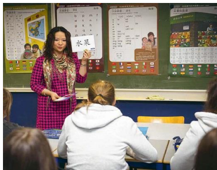
Cours gratuits de chinois