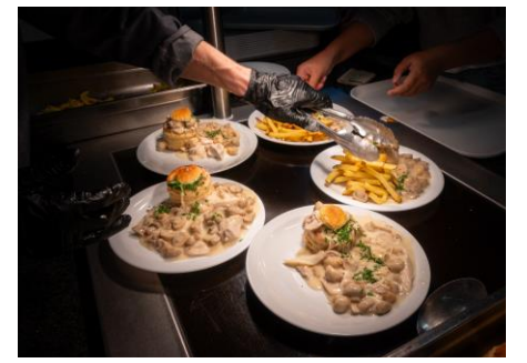
Restaurant scolaire rénové & produits frais de saison